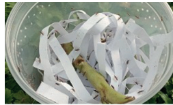
Boite de N. volucer lors d'un lâcher