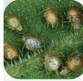
Momies de puceron